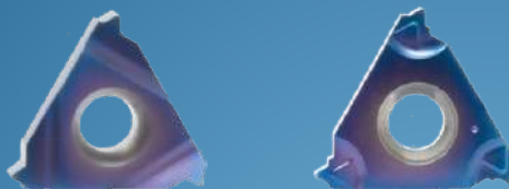
ISO - destička Typ B = destička s lamačem třísek

BMA = Základní povlak – první volba – pro 90% aplikací pro soustružení závitů. Velmi jemná struktura karbidu s PVD povlakem na bázi TiAlN pro běžné používané oceli, korozivzdorné oceli a zvláštní materiály. Pro střední až vysoké řezné rychlosti.