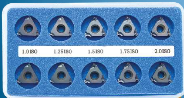
A-KIMB (BMA nebo BLU) VNITŘNÍ SADA ISO - metrická

16 ER 1.0 ISO – 2 kusy 16 ER 1.75 ISO – 2 kusy 16 ER 1.25 ISO – 2 kusy 16 ER 2.0 ISO – 2 kusy 16 ER 1.5 ISO – 2 kusy