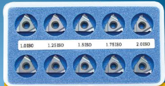
A-KEM (BMA, BLU nebo HBA) VNĚJŠÍ SADA ISO - metrická

16 IR 1.0 ISO – 2 kusy 16 IR 1.75 ISO – 2 kusy 16 IR 1.25 ISO – 2 kusy 16 IR 2.0 ISO – 2 kusy 16 IR 1.5 ISO – 2 kusy