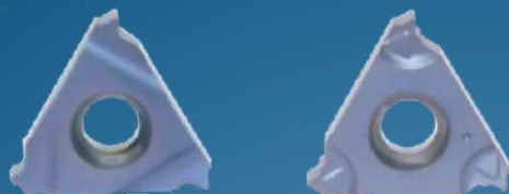
ISO - destička Typ B = destička s lamačem třísek

BMA = Základní povlak – první volba – pro 90% aplikací pro soustružení závitů. Velmi jemná struktura karbidu s PVD povlakem na bázi TiAlN pro běžné používané oceli, korozivzdorné oceli a zvláštní materiály. Pro střední až vysoké řezné rychlosti.