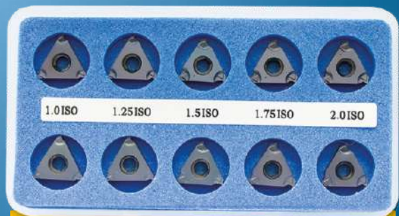
A-KEMB (BMA nebo BLU) VNĚJŠÍ SADA ISO - metrická

16 IR B 1.0 ISO – 2 kusy 16 IR B 1.75 ISO – 2 kusy 16 IR B 1.25 ISO – 2 kusy 16 IR B 2.0 ISO – 2 kusy 16 IR B 1.5 ISO – 2 kusy